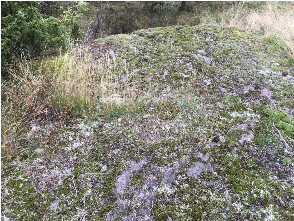
Naturtype «åpen grunnlendt kalkrik mark i boreonemoral sone», Lokalitet Svenes, Barmen

Risør kommune har mottatt tilskudd på 400 000 kr fra Miljødirektoratet til utarbeidelse av kommunedelplan for naturmangfold. Dette tilskuddet vil hovedsakelig gå til å bekoste naturtypekartlegging. Øvrige kostnader vil dekkes av ansattes arbeidsinnsats og over eksisterende budsjett i avdelingen (møter, annonsering osv.).