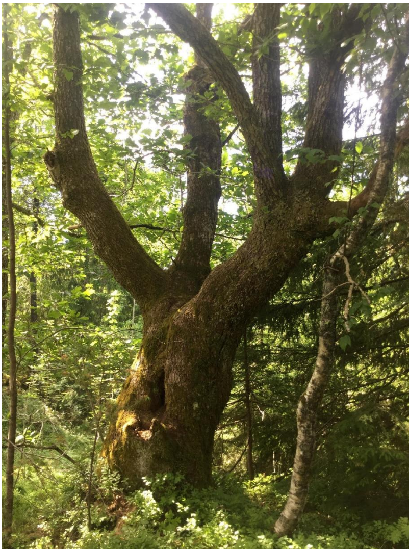
Naturtype hul eik, Lokaltet Kallerberget