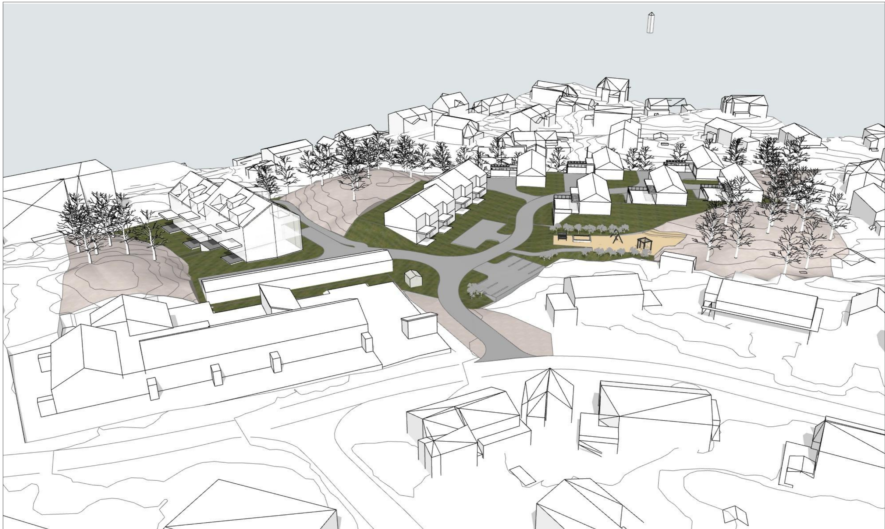
Oversikt fra Syd-Vest