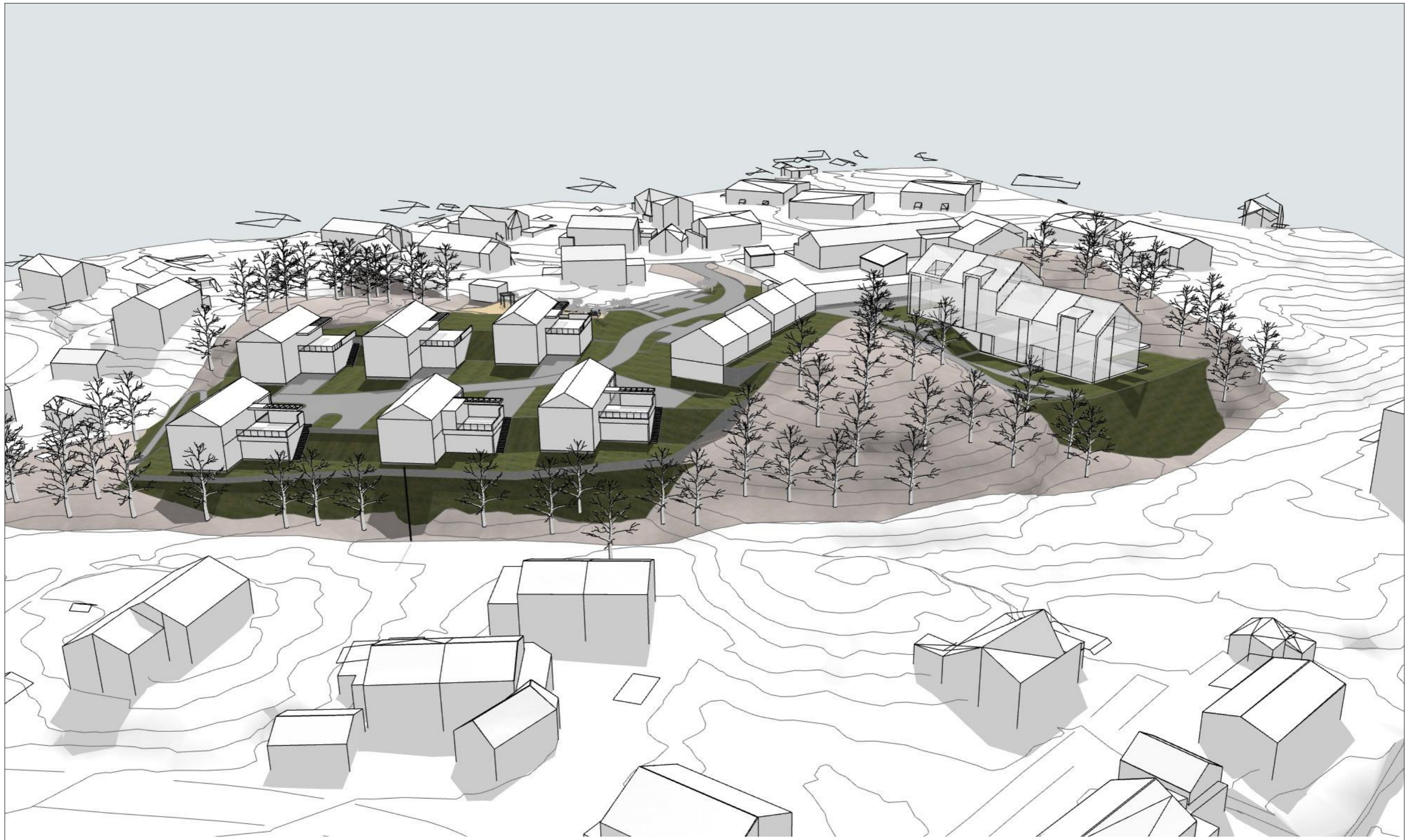
Oversikt fra Nord-Øst