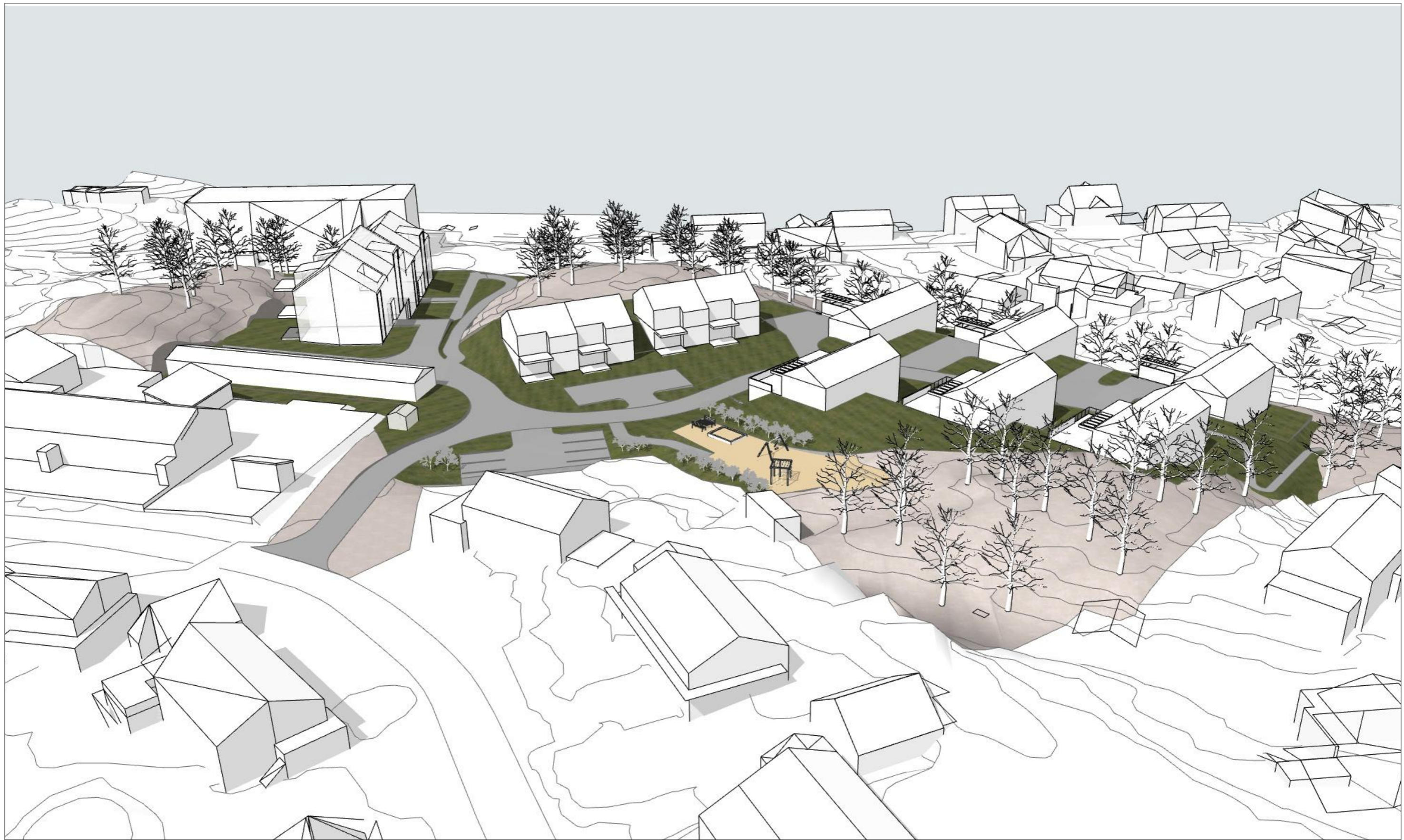
Oversikt fra Syd