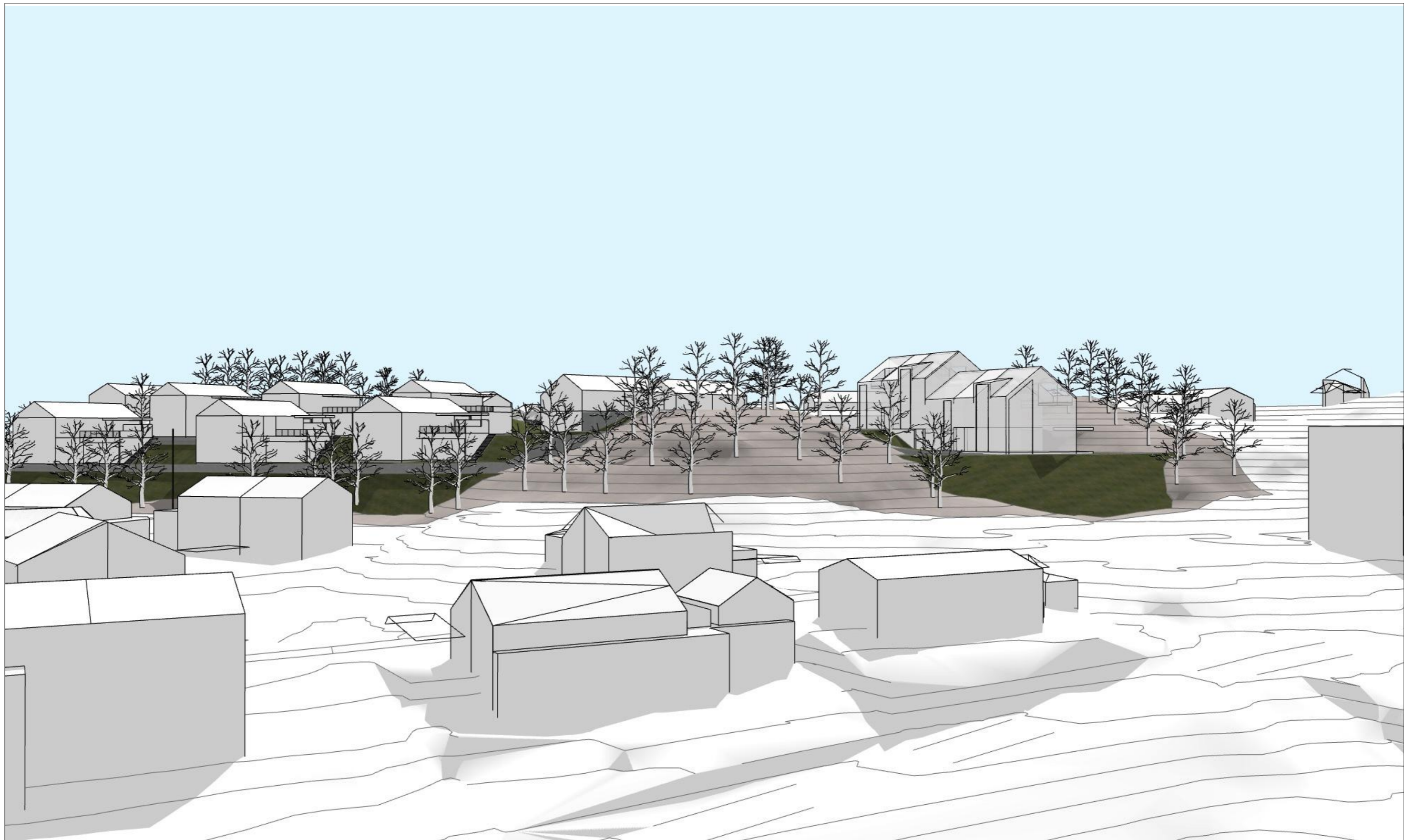
Sett fra Nord-Øst