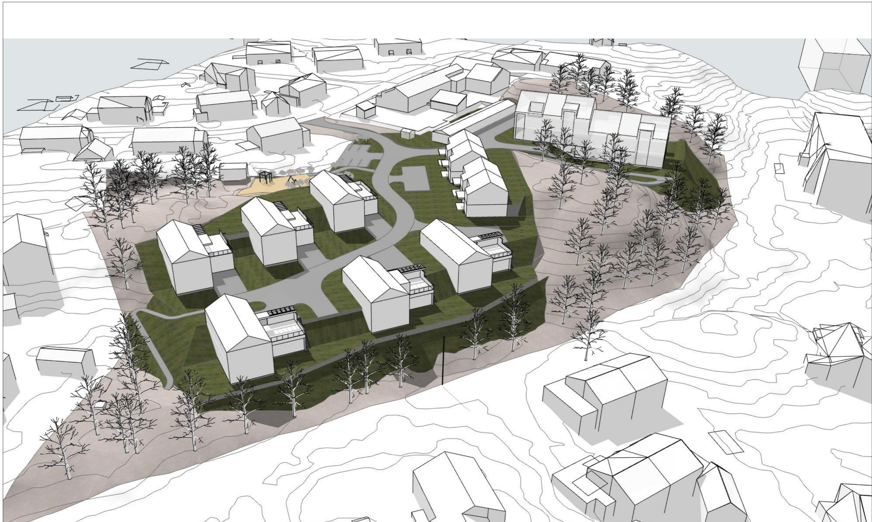
Oversikt fra Øst