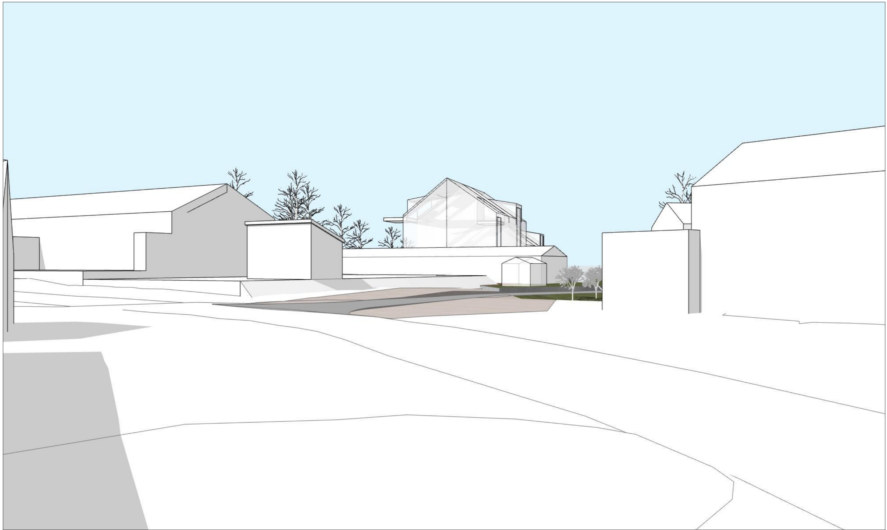
Sett fra Tyriveien