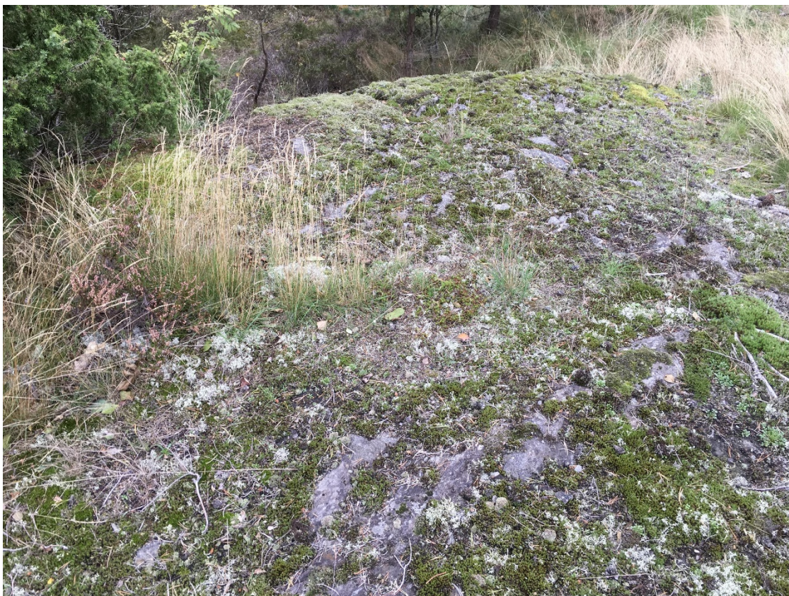
Naturtype «åpen grunnlendt kalkrik mark i boreonemoral sone», Lokaltet Svenes, Barmen

Risør kommune har mottatt tilskudd på 400 000 kr fra Miljødirektoratet til utarbeidelse av kommunedelplan for naturmangfold. Dette tilskuddet vil hovedsakelig gå til å bekoste naturtypekartlegging. Øvrige kostnader vil dekkes av ansattes arbeidsinnsats og over eksisterende budsjett i avdelingen (møter, annonsering osv.).